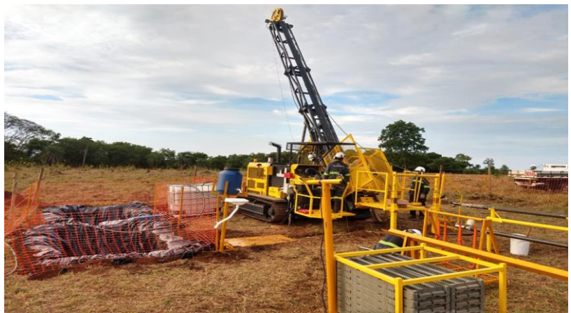
Praça de sondagem da Geocontrole, empresa contratada que realiza a sondagem para a equipe de Exploração.

Ao iniciar as atividades de exploração, em 2008, estimava-se que a vida útil de Chapada iria até o ano de 2027. Entretanto, com os trabalhos de sondagem dos últimos anos, conseguimos estender a lavra até 2050.